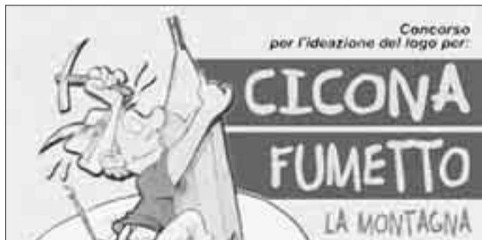
La locandina per il concorso sul logo

CANAL SAN BOVO - Sigh! Crash! Slurp! Boom! Quest'estate il cuore verde del Vanoi sarà pervaso da onomatopeici a gogò. Il fumetto diventa protagonista indiscusso. Lo spunto è aprire un percorso comunicativo, particolare e sognatore come solo il fumetto può essere, che annualmente faccia approdare nelle varie frazioni della valle gli autori del settore con relative opere al seguito. Un appuntamento fisso che sappia calamitare appassionati e turisti. Asterix & Co. incontreranno la montagna con la sua storia per raccontarla o sarà la montagna con la sua storia a incontrare loro per raccontarsi? La biblioteca comunale di Canal San Bovo, le Pro Loco di Prade, Ciconna, Zorzea, il consorzio turistico Valle del Vanoi e l'Ecomuseo del Vanoi, unitamente ad altre realtà territoriali, si lanciano in quest'avventura, intanto, promuovendo un concorso su scala nazionale, riservato ai giovani fra i 15 e i 30 anni, per la creazione del logo «Ciconna Fumetto». Il logo dovrà caratterizzare il territorio e coniugare l'obiettivo di valorizzare l'offerta turistica che incontra questa particolare forma di comunicazione. Super-